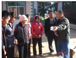
给村民讲解沼气知识