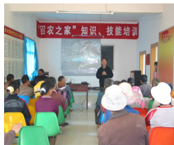
给沼农做沼气知识培训