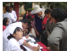
到村子里做环教宣传