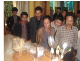
农民在看沼气模型

通过选择项目点，评价与激发农户的积极性与主动性以及参与意识；建立“沼农之家”，为沼农户能通过这个平台找到更多更好适合自己的沼气的管理方式，并能有更多的机会与外界进行交流沟通。通过沼气相关知识培训，加强沼农户对沼气的管理能力。以“沼农之家”作为示范，加强沼气使用、管理及可再生能源的宣传。