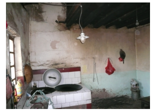
沼气灶具和沼气灯