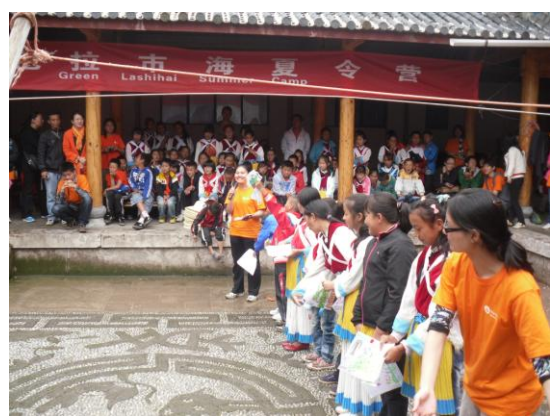
大家感受环保话剧的精彩