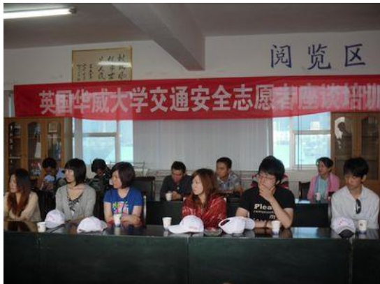
与丽江交警座谈培训