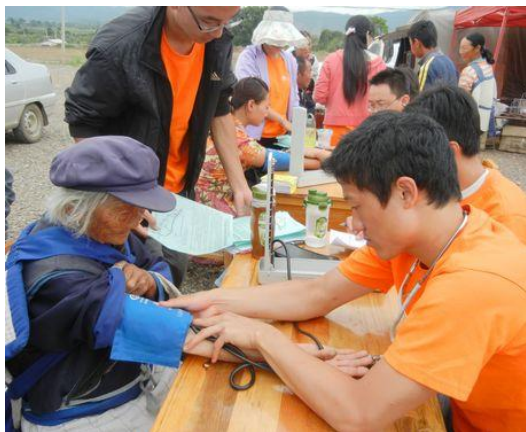
湘雅医学院学子们在乡村集市为村民义诊