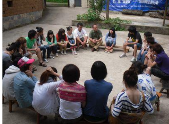
中英大学文化、教育交流分享