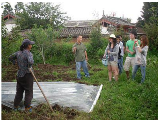
在地头与村民交谈, 了解纳西农村