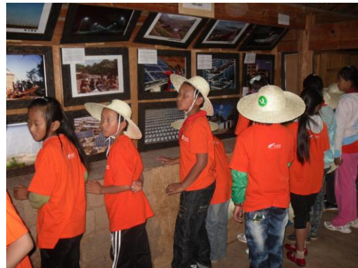
参观可再生能源展厅