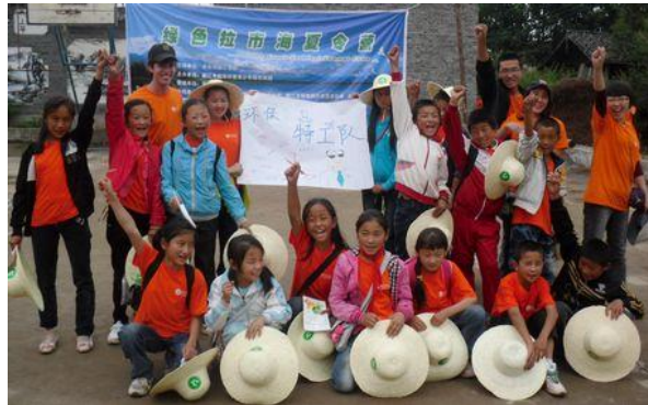
我们是“环保特工队”，耶！