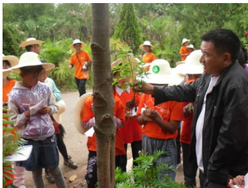
了解湿地里的外来入侵物种