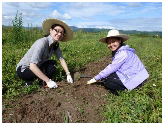
大学生们走进田间地头开展助农活动

2011 年 7 月 30 至 8 月 1 日，“绿色拉市海夏令营”在丽江绿色教育中心拉开了帷幕。为期三天的夏令营活动中，美国耶鲁大学与中南大学湘雅医学院的二十名学子携手拉市乡七所完小的八十余名师生共同开展了一系列益智趣味环保系列活动的夏令营，让乡村孩子快乐地学习农村可再生能源及湿地生态保护的相关知识，在中美文化的交流中开拓孩子们的眼界和见识，携手推动拉市海湿地的生态保护。