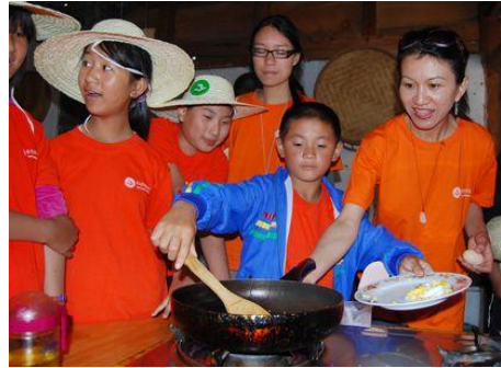
体验用沼气剪鸡蛋的快乐