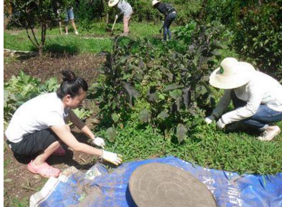
为菜地、沟渠除草, 体验农村生活