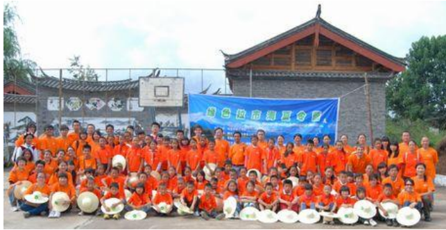
绿色拉市海夏令营即将开始