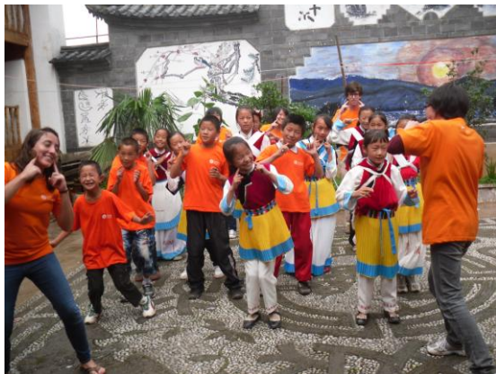
联欢活动上，小营员与大学生们一起 happy！