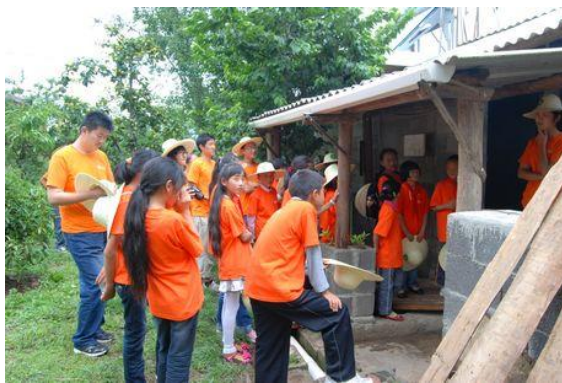
了解沼气生产的“奥秘”