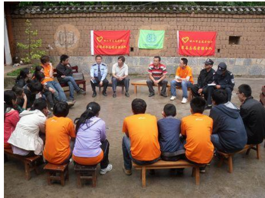
大学生们关注丽江交通安全、禁毒情况