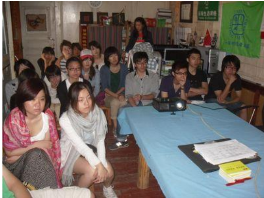
了解家园及拉市海湿地情况

2011 年 8 月 3 日至 11 日, 华威 CPASS 协会在绿色教育中心的协调安排下展开了为期八天的云南农村志愿服务活动。这也是首次与英国的大学合作, 为期八天的行程安排让华威学子们不仅参观学习了家园独特的低碳教育模式, 体验了纳西农村生活, 同时也全面了解拉市海湿地周边的生态环境保护状况, 以便将来与家园持续合作共同推进当地生态环境的保护。与此同时, 学子们还走进古城中心与交警们一起执勤, 真真切切地体验到当地交通警察的辛苦以及交通安全的重要。