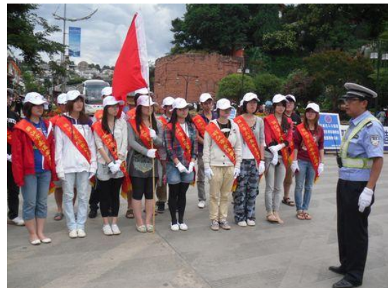
走进古城中心体验交通执勤