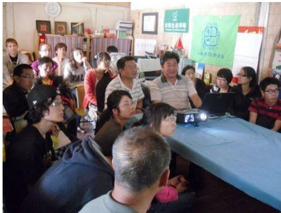
与拉市海湿地管理局专家交流，了解湿地情况

来自美国耶鲁大学和湖南中南大学湘雅医学院的二十名学子在丽江市能环科普青少年绿色家园（即绿色教育中心）的精心组织和安排下，中美师生在丽江农村开展了为期八天丰富多彩的农村社会实践和环保活动：