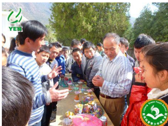
琳琅满目的手工制品吸引大家

2011年11月24日，公共意识宣传培训在玉龙县第四中学举行。玉龙四中坐落在拥有“长江第一湾”的石鼓镇，属于老君山片区，环保公共意识宣传活动在这个地方进行显得尤为重要。活动中，四中学生们利用废旧物品用心制作的手工艺品、垃圾分类标本的展示和表演活动让学生更生动直观地了解垃圾分类和保护野生动物的重要性。当天下午，老师们又马不停蹄的到了石鼓镇的大同完小，活动现场得到了当地村民的帮忙，他们主动来帮助我们挂展板、拉布标布置会场。这次的小手拉大手活动表现最棒：三个学生家长与孩子同大家分享了各自的垃圾分类经验和家庭环保教育，让参与者受益匪浅。