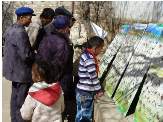
“小手拉大手”我和爷爷一起学习