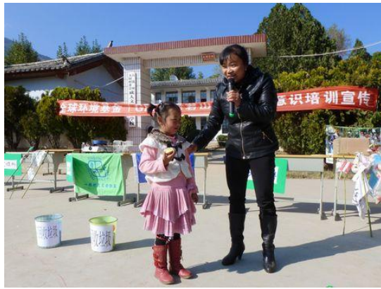
“小手拉大手”活动中学生家长分享垃圾分类经验