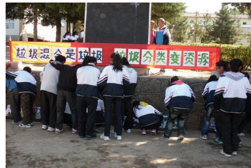
精彩的图片也吸引了学生的目光