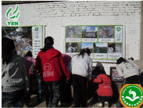
“随意丢弃的垃圾”图片引起学生关注