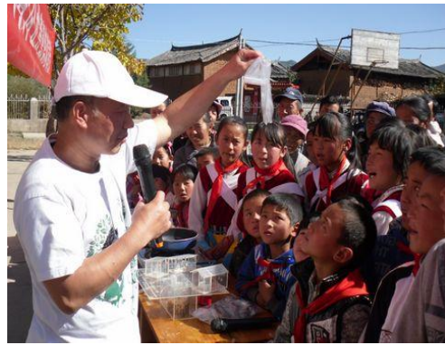
孩子与家长们听老师讲解沼气知识

11月11日,公共意识宣传活动第二站来到了玉龙县二中,全校共计有五百多名师生参与本次活动。活动以低碳讲座的方式与在校师生共同探讨低碳话题,并用大量的警示图片展示低碳行动和垃圾的危害,讲座互动中同学们认为:少开车,多走路、骑单车是最低碳环保的出行方式,在生活中垃圾分类减量或者多植树也是低碳的办法。通过讨论学生们共同起草并宣读《绿色校园倡议书》,以此倡议在学习和生活中用实际行动来践行低碳!