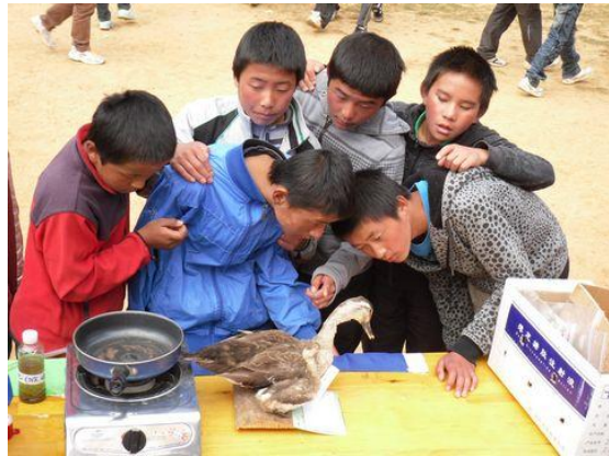
太安中学学生认真观察候鸟标本