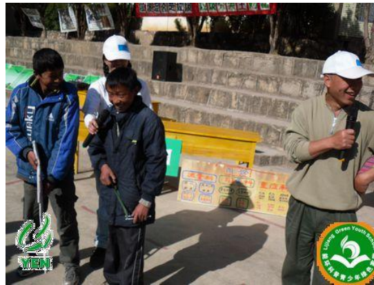
动物保护参与表演的现场志愿者