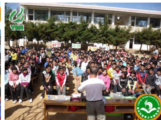
太安中学 400 多名师生聆听科学环保讲座