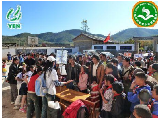
认识有毒垃圾，学会科学处理