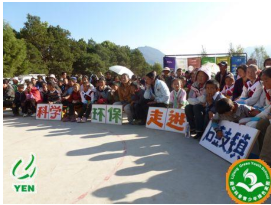
村民与孩子们共同参与活动