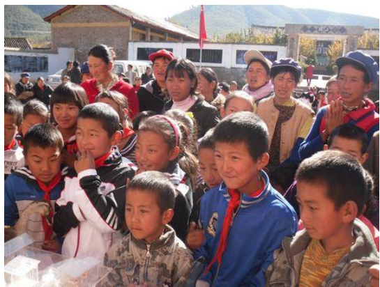
太安完小的学生和家長了解沼气池的“奥秘”

25日，生态网绿色教育中心的老师们再一次来到太安乡，在太安乡完小开展小手拉大手一起学环保的公共意识宣传活动，让我们一起感受活动现场的精彩吧：