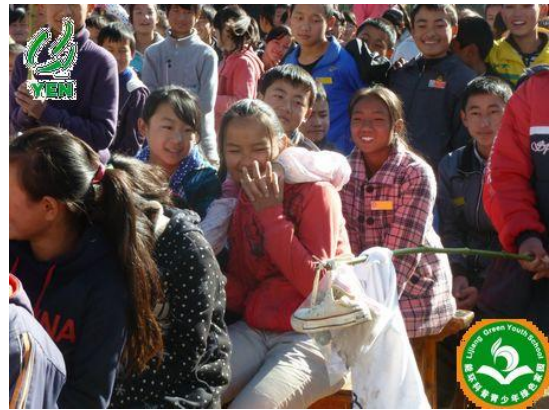
用垃圾制作的拉风道具展示在学生面前