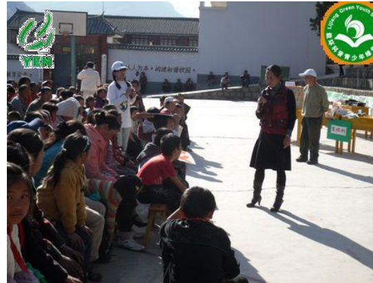
学生家长为垃圾减量支妙招！