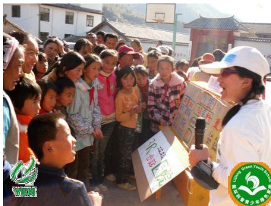
让我们一起到 3R 医院来给垃圾会诊吧！