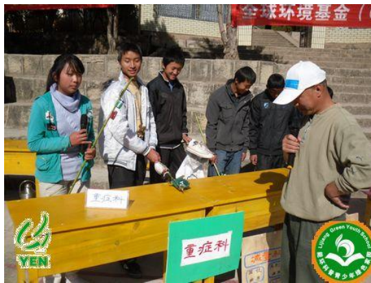
参与者学习垃圾归类

2011年11月28日，云南生态网绿色教育中心的老师们走进位于老君山腹地的石头乡，为石头中学的三百多名师生们开展环保公共意识的讲座，而下午为石头完小两百多名师生和家长做宣传活动。互动过程中，上台展示垃圾分类的学生不仅明白垃圾的危害，同时倡导大家少用或重复使用各种容易产生垃圾的物品，这样的情景让我们欣喜不已。在石头完小，分组走上台参观的小学生和家长们对“重症科”如：农药瓶、废旧电池、医疗废弃物等垃圾的处理很关心，培训师们根据当地的实际条件给予村民一些建议，同时也有家长走上讲台为垃圾减量支招。