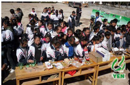
玉龙二中学生围观垃圾分类的展品

11月11日,公共意识宣传活动第二站来到了玉龙县二中,全校共计有五百多名师生参与本次活动。活动以低碳讲座的方式与在校师生共同探讨低碳话题,并用大量的警示图片展示低碳行动和垃圾的危害,讲座互动中同学们认为:少开车,多走路、骑单车是最低碳环保的出行方式,在生活中垃圾分类减量或者多植树也是低碳的办法。通过讨论学生们共同起草并宣读《绿色校园倡议书》,以此倡议在学习和生活中用实际行动来践行低碳!