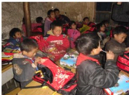
活动剪影：当看到贫困山区孩子们开心地领取学习用品的那一刻，我们的努力是值得的！

据了解，曲靖富源县富村镇拉谷村，因所处的地理环境太差，村子里人多地少且贫，出产的农作物产量不高，村民收入微薄，90%的青壮年到山外去打工去了，村里留下的基本是老人和妇女、儿童，整个村子里只有一所只有一二年级的简陋“学校”和一个本村的老师，更多的学生需要走很远的山路去上学。志愿者们了解情况后立即在校园内发起爱心募捐活动，力所能及地帮助那些贫困的孩子们。