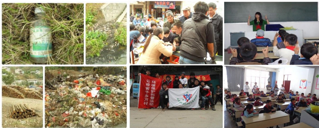
令人堪忧的环境状况

★ 在一起的那些时光——记千乡万村活动： 2012年2月17—21日，云南大学滇池学院 唤青社 和云南省环境科学保护协会联合开展了千乡万村活动。此次活动共分为两个队，一队前往曲靖市罗平县八大河村，另一队前往蒙自市文澜镇余家寨和马房村。活动中，我们进行了农村环境调查、环境教育、环境宣传、入户调查，以及与相关部门负责人进行座谈等活动，也通过这一系列的活动大致认识当地生态农业建设现状，针对存在的问题共同探讨解决方案。充分运用大学生的知识对于存在的生态环境进行探究，并对其提出可行性的建议，传播农村生态环境保护的理念，增强村民的保护意识。达到互相学习，加强交流的目的，培养队员的责任心和自身能力及其热爱自然、保护自然之意，并且带着这份情意融入到平时的学习生活中去，影响更多人。