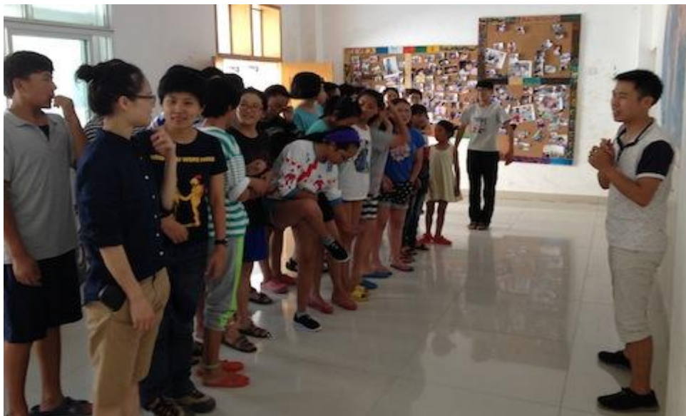
学友们参与孤儿院同学们认识更多朋友活动

2014年7月28日来自川、黔、滇、渝的一群学友相逢在九寨沟，开展了为期两天的公益环保活动。第一天学友们到九寨沟镇的方舟残疾孤儿院与残疾孤儿们做互动游戏、看电影，并参与了重庆学友捐赠了物资仪式活动。第二天，学友们分成四个小组在九寨沟沟口内外开展“垃圾不落地”公民旅游宣传活动。本次九寨沟之行绿色家园的陈老师与其他学友们共同分享了公民素养教育活动心得。