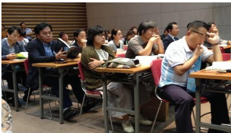
在论坛上的韩国参会代表