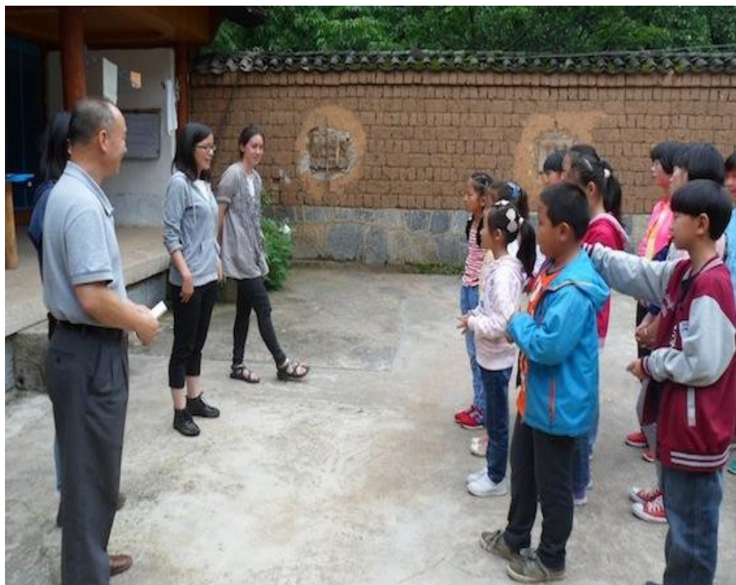
夏令营组织方的老师与小营员们见面

丽江“2014小公民夏令营”于2014年7月18日下午4时在绿色家园正式开营。来自丽江市福慧和实验学校的14名8岁至14岁的同学们报名参加了这次夏令营。为期2天的夏令营安排在周末，为家长和孩子们同时创造了各自的需求：参加夏令营的同学们以绿色家园为家，学习与拉市海湿地保护有关的环保科学知识和技能，关注公益和公共环境问题，以此启发他们发现和感悟自己在文明和道德素养方面存在的差距，并引导他们通过学习和行动来缩小差距。家长们则可以重新悠然计划周末的安排，做一些大人们喜欢的事情了。