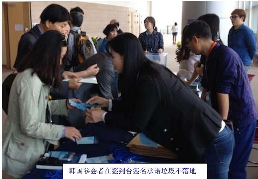
韩国参会者在签到台签名承诺垃圾不落地

本届论坛召开期间，向与会者宣传垃圾不落地的意义和操作要领，这一提议很快获得主办方的认同。在论坛签名报到处，韩国