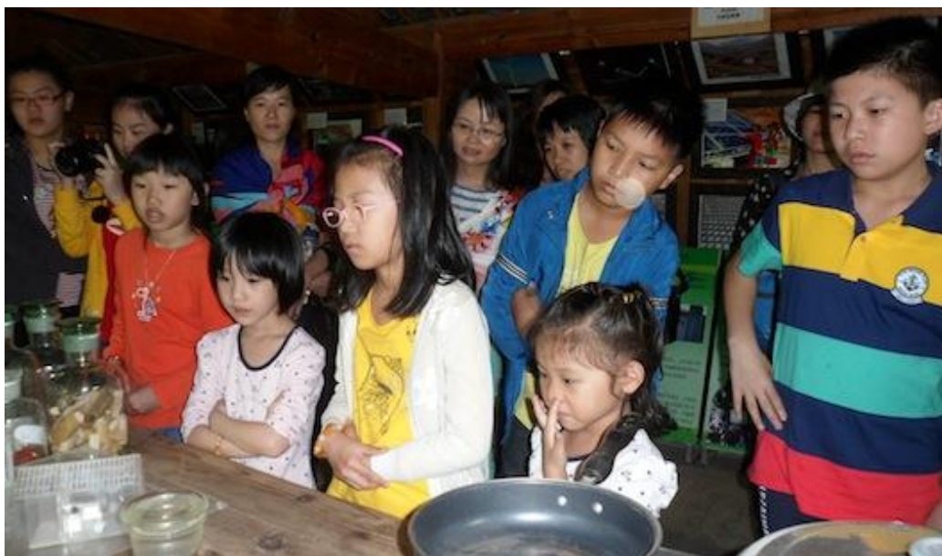
新颖的沼气讲座吸引家长和孩子们的注意力

7月16号21名来自广东深圳的游客（其中家长10人、孩子11人）在丽江白鹿旅行社导游的带领下走进丽江绿色家园。这批由大人和孩子组成的旅行团在前往拉市海观光旅游期间，不是先去骑马划船，而是大人和孩子一起来绿色家园学习拉市海湿地保护知识。通过参观和聆听讲解，家长和孩子们学习了有关的拉市海湿地知识，加深了对拉市海湿地保护的认识。