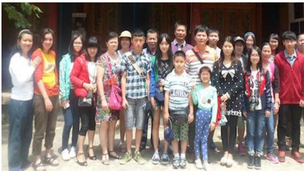
与家园老师们合影留念