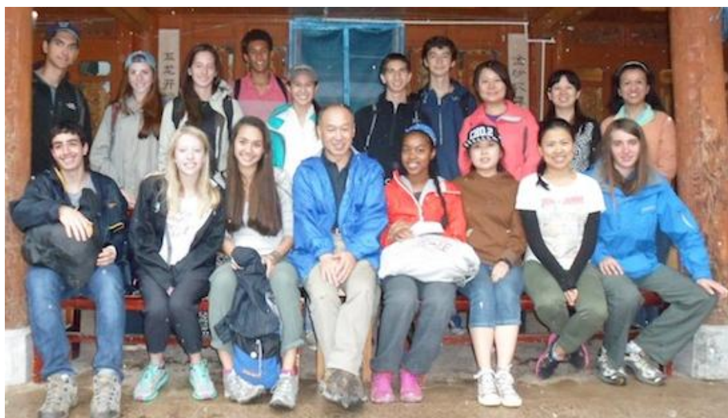
快乐的美国中学生