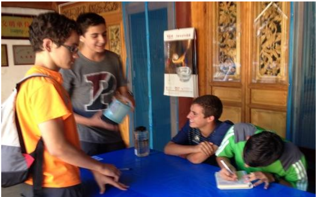
我承诺垃圾不落地