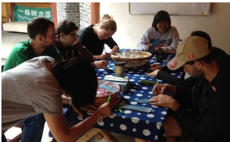
同学们纷纷承诺垃圾不落地