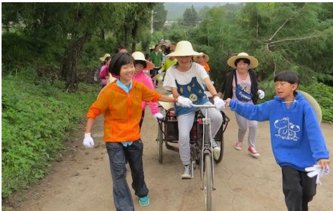
马场里的小公民在行动