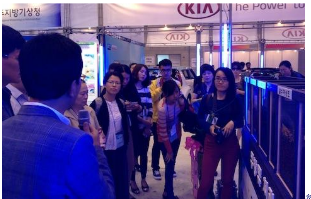
参观新能源产业展