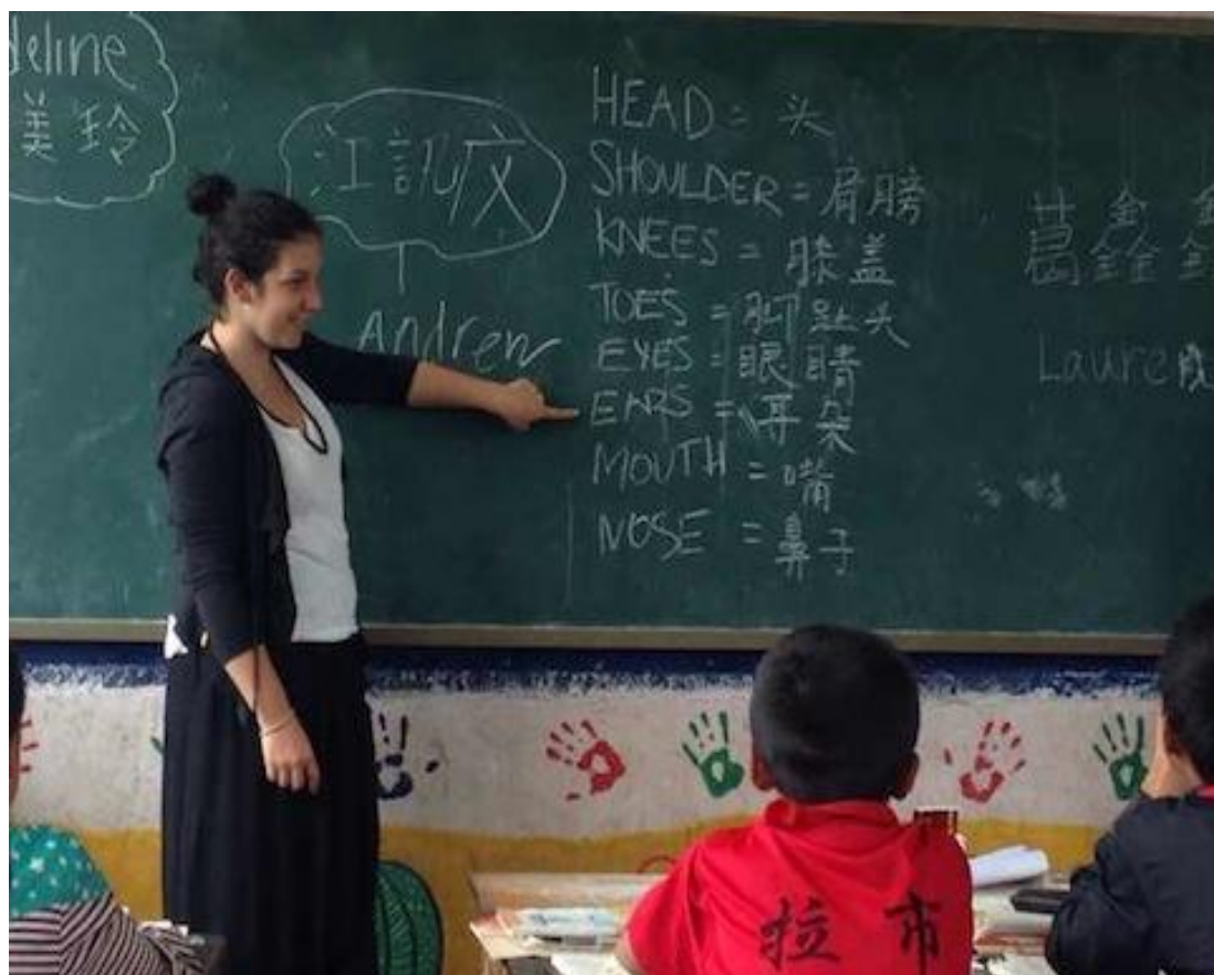
教英语的外国学生

Today teacher Liu and I brought the “Where There Be Dragons” students to a village primary school at the southern part of the lake. “Where there Be Dragons” is an cultural and education American program that brings American students to different countries, one being China. Today, the students taught an English class to fourth year and fifth Chinese year students. Activities included giving the Chinese students English names, drawing animals, and teaching the the American children’s song “Head and Shoulders.” After class, three Where There Be Dragons students were interviewed by Li Jiang local Television Station, and the high school students were eager to answer in Chinese. They explained that they enjoyed teaching English to the students, and that these Chinese students were very bright and hardworking.