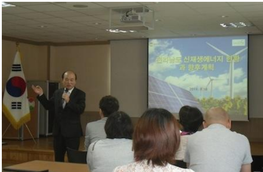
光州绿色能源研究院院长在作介绍

在光州会议和参观期间，感受到光州在新、可再生能源的研发、应用及教育宣传方面十分普及，城市建筑和公共空地不经意间都会看到太阳能利用的影子。能源利用渗透到生活的方方面面，尤其在青少年教育方面。