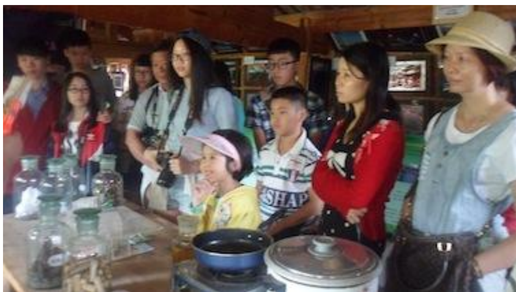
学习垃圾分类知识

7月25号，一辆旅游大巴从大丽高速拉市海出口出来后就直奔绿色家园，云南阳光假日旅行社的导游和绿色家园的老师早就等候在家园入口处，准备迎接这批来自广东的游客。这个旅游团队由老人、家长及其孩子们包括一名刚上一年级的小朋友组成，他们通过英特网了解到绿色家园正在开展低碳环保教育后，向组团旅行社提出到丽江先到绿色家园补充环保科学知识，然后再参加接下来的旅游活动，意在树立旅游中的环保意识，给团队成员一个全新的假日出游体验。因此，出现了前面到“丽江先到绿色家园”的一幕。