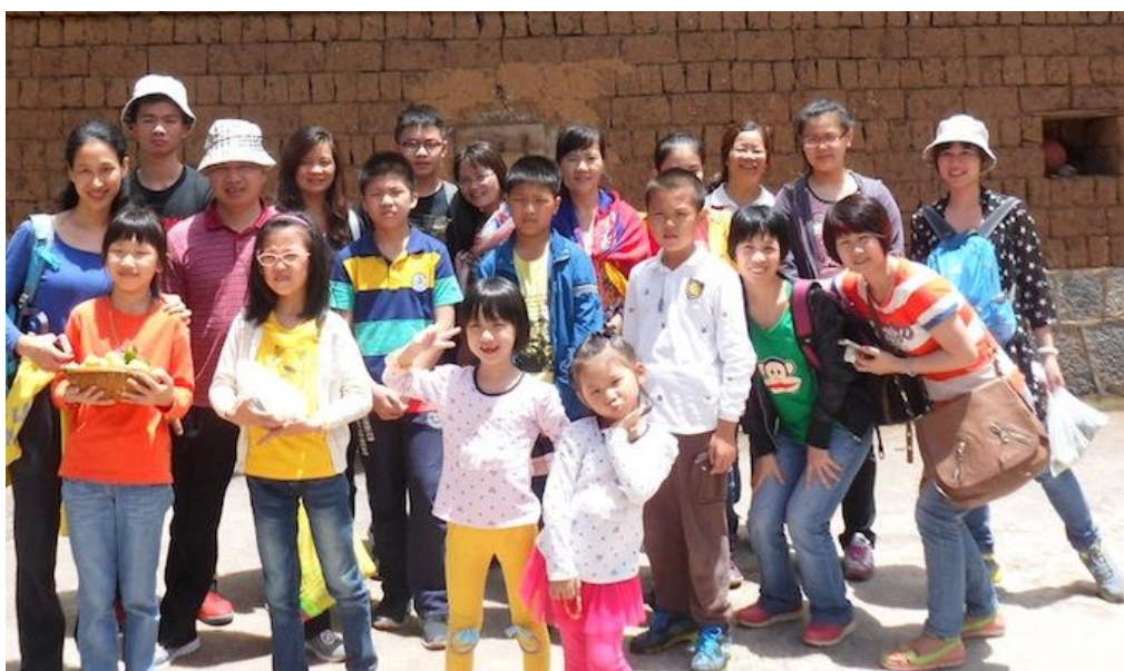
参与环保我们快乐