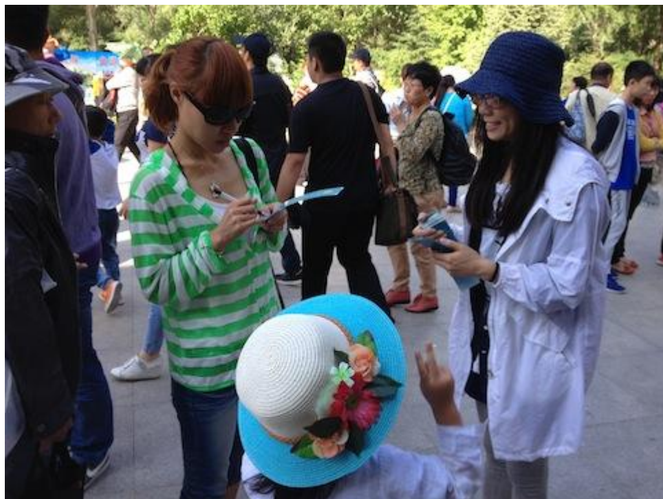
学友们参与孤儿院同学们认识更多朋友活动