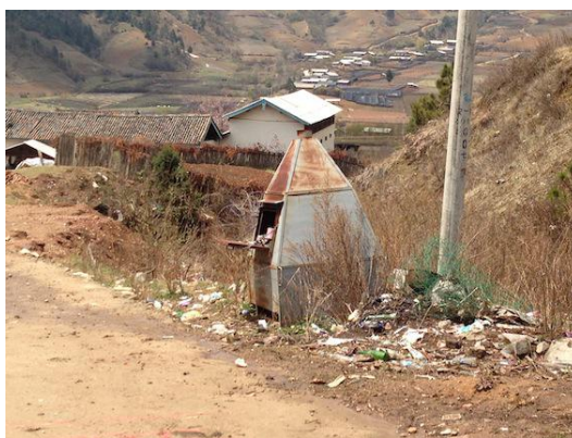
山区垃圾焚烧炉普遍缺乏管理