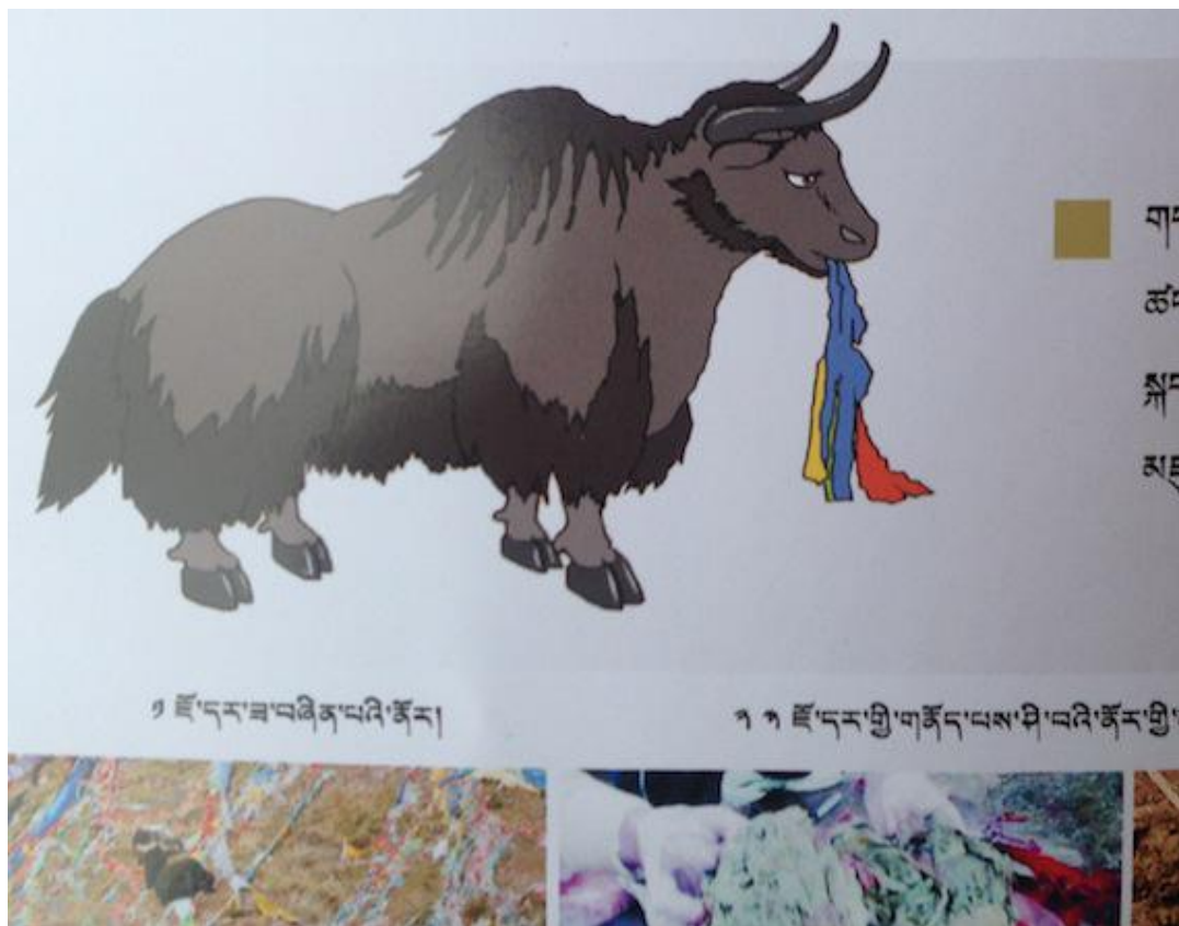
到处泛滥的垃圾对当地牦牛生存带来了致命的危害（图片来自《论垃圾》）研讨会现场