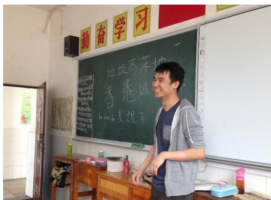
在支教课堂上的香港城市大学大学生

按照此项计划安排，同学们在4天的时间内走完了拉市海6所完小和1所农村中学，向当地学校师生和前来听课的家长们讲解和示范了垃圾不落地的4字要领。他们直观简洁的示范和浅显易懂的要领讲解，让学生和家长们较短的时间内不仅明白了垃圾不落地的字面意思，而且还学会了如何动手做到垃圾不落地。