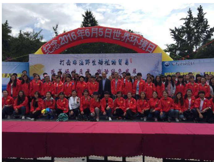
参加活动的云大旅院青协的大学生志愿者