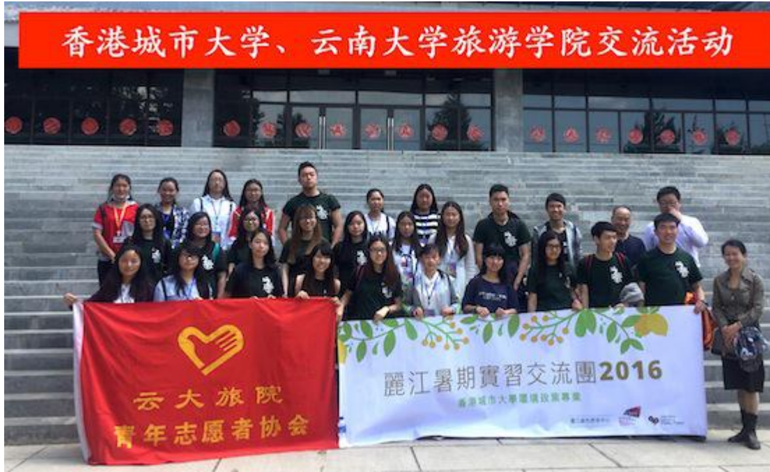
在丽江云南旅院与该院大学生社团青协同学合影