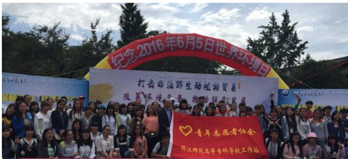
参加活动的丽江师专青协志愿者们

本次环保活动启动仪式，首先领导致词宣布活动正式开始，其次为征文比赛获奖学生颁奖，观看节目表演，在此过程当中有知识竞赛抢答以及垃圾不落地签名互动环节等。据领导介绍这是第45届世界环保纪念日，同时领导也做出垃圾不落地承诺，丽江会一直响应环保政策，建设大美丽江，并推动节能减排，垃圾不落地的发展。