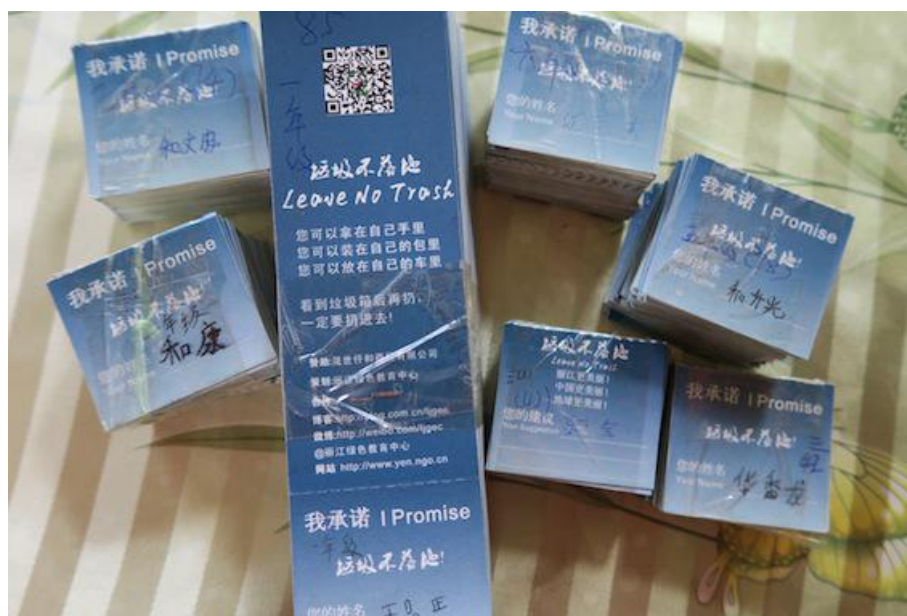
500 名学生和家长签名承诺垃圾不落地！

杵峰完小“爱家、爱村、爱杵峰保护小村河行动”培训动员活动后，一场声势浩大的保护小村河行动在下午 1 点半正式打响。在以杵峰村集市为中心的小村河上段和下段约 1 公里的河段上近 600 名村民和师生们沿河两岸进行拉网式地清理垃圾，杵峰幼儿园的师生也不甘示弱加入到清理垃圾的行动中来。他们在河边、道路两旁捡垃圾、在河流中捞垃圾，在沟渠内清垃圾、在空旷的地方烧垃圾，剩下的垃圾则由拖拉机清运到指定地点填埋。活动的场面十分壮观，收获的喜悦挂在了每一个人的脸上。当问及家长，这么好的天气不去地里干活而是来这里捡垃圾后悔吗，村民笑答：不后悔啊。当幼儿园的老师问陈老师：大班的同学可以参加活动吗？陈老师回答：可以。听到回答，大班的孩子们高兴地跳了起来。