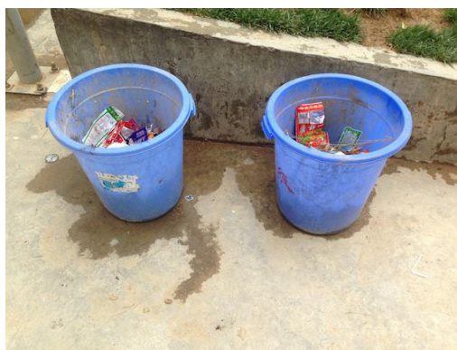
校园每天平均产生 20 桶垃圾

绿色家园陈老师向师生和家长们现场示范了垃圾不落地和垃圾分类的要领。全体师生和村民在蓝天白云的见证下，庄严承诺垃圾不落地！借此机会，项目邀请云南思力替代技术发展中心的杨主任为村民们讲了一堂生动的“巧妙使用农药化肥”的科普课。村民们通过培训，开始对农药的安全知识，妇女儿童健康以及农药标签识别有了清晰的认识，对农药废弃物的处置有了更多的警觉。