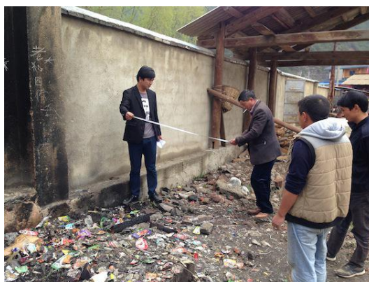
杵峰完小和校长在配合校园垃圾坑丈量