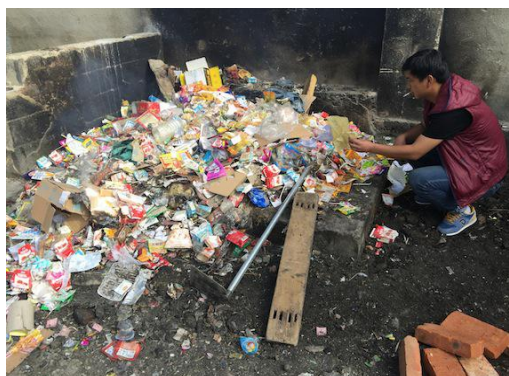
未建垃圾焚烧炉前

玉龙县鲁甸乡边远山区学校杵峰完小在绿色家园“建设校园垃圾不落地”项目的协助下，近日完成了垃圾终端管理建设，并初步通过了学校验收。杵峰完小是一所边远封闭的山区学校，每天校园营养餐废弃餐盒以及同学们产生的大量垃圾极大地困扰着学校师生，对校园卫生和旁边的小村河产生负面影响。近日完成的垃圾处理终端设备将阻断垃圾外流污染周围环境。根据项目安排，学校将配合终端设备，梳理和调整校园环境卫生管理制度，建立严格的垃圾分类处置安全措施和透明的管理制度，在师生中倡导绿色消费。