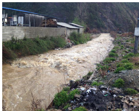
小村河汹涌的河流将垃圾冲刷至金沙江内

四月底，滇西北山区的雨季提前来临。连续一周的连绵细雨造成了小范围的山石滚落、山土滑坡，使鲁甸乡到杵峰村的村级道路时有堵塞发生。连续的雨天使村民也无法出工务农。4月24日晚一夜的瓢泼大雨使小村河河水暴涨，泥流夹杂着人们抛弃的垃圾被汹涌的河水无情地冲刷至下游。