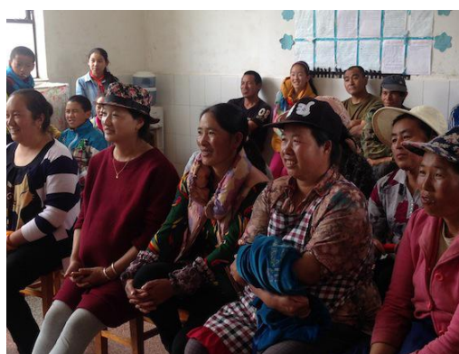
参加小手拉大手垃圾不落地听课的家长们

香港同学们的实习还包括清理和分类图书活动，在多能互补的低炭厨房内动手洗菜做饭等。所有这些活动安排极大地丰富了同学们的实习内容，锻炼了他们的动手能力、检验了他们的团队意识和解决困难的毅力和决心。