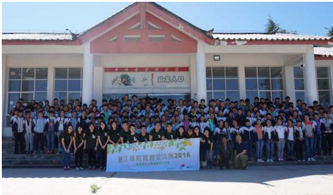
与玉龙二中全体同学合影留念