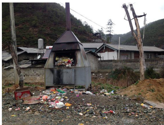
村里不规范的垃圾焚烧