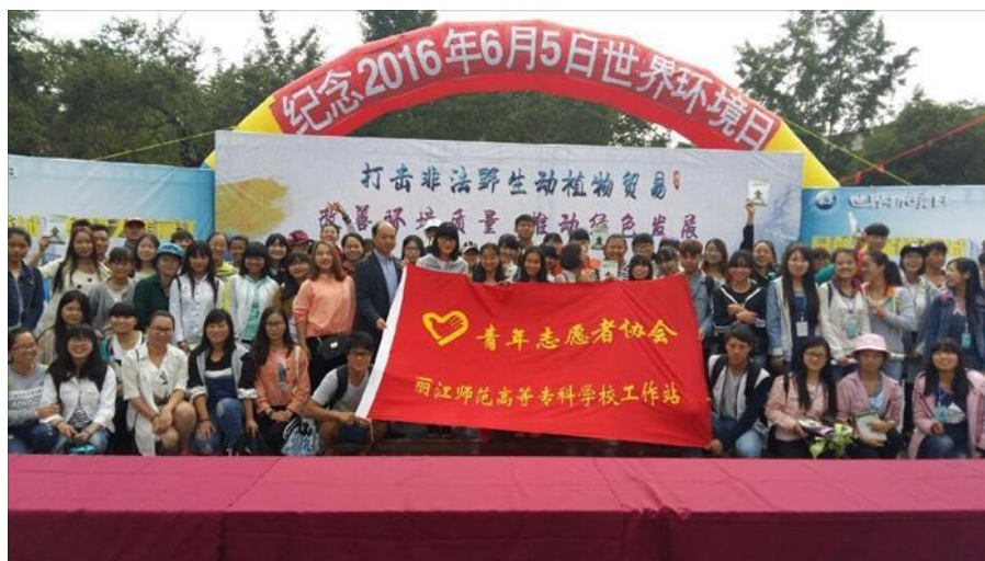
校团委青年志愿者工作站供稿

参与本次活动，让我们懂得了，环保活动人人有责，作为一名志愿者，我们更应该从自身做起，从身边的小事做起，做环保活动的宣传者、实践者、推动者。