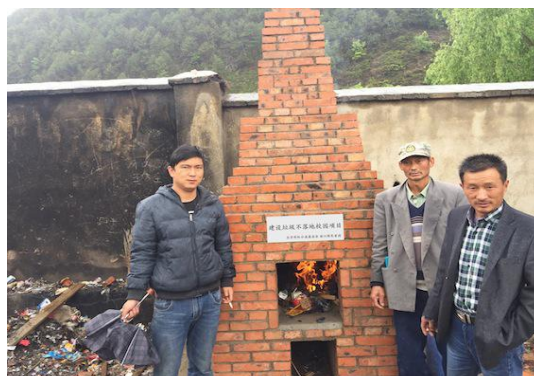
在新建成的垃圾焚烧炉旁进行焚烧试火